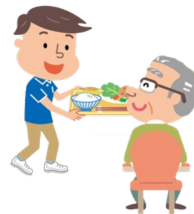
Portage de repas pour les personnes âgées ou malades