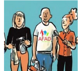
Mandataire pour les particuliers-employeurs d'aides à domicile

LETS SPEAK ENGLISH INFORMATIQUE DEBUTANTS