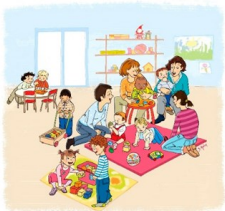
Relais Assistant(e)s Maternel(le)s