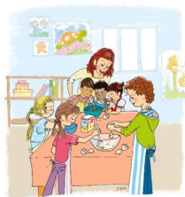
Accueil de loisirs : mercredis, petites et grandes vacances