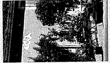
Chez l'Gars Roux.